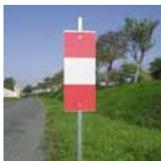
K5b simple face ou double face