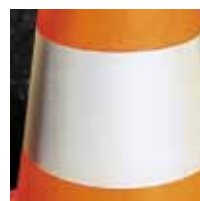
Consheeting - CL 1