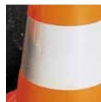
Classe 2 - CL 2