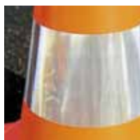
Prismatique - BP