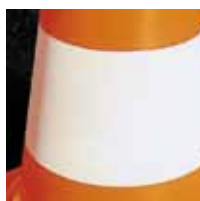
Rétro billes de verre - BR