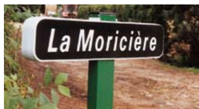
E 31 - Gamme EUROP