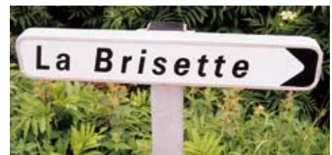
D 29 - Gamme BRETAGNE