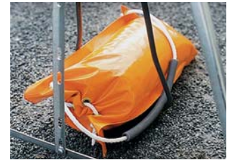
Sac de lest 25 ou 15 kg