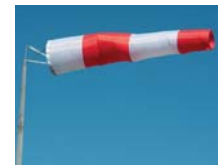
Manche à air