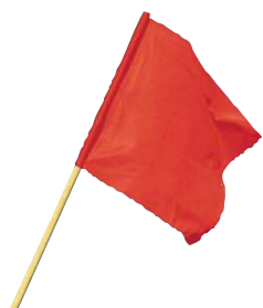
Fanion NK 1