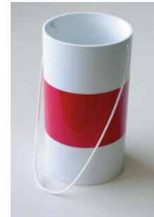
Fardier type Eco Fe 216