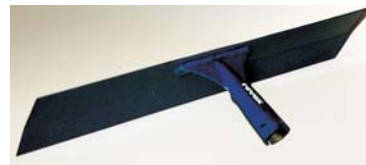
Raclette à enrobé Acier spécial de résistance 110 Kgs. Douille soudée : longueur 50 cm