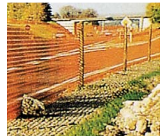
Balisage plastique Nadeco