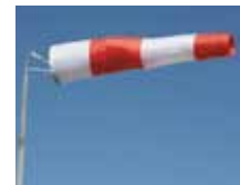
Manche à air