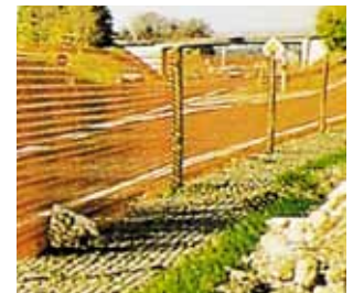
Balisage plastique Nadeco