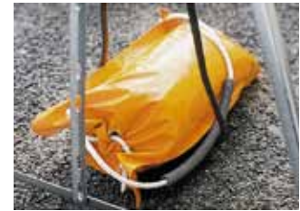
Sac de lest 25 ou 15 kg