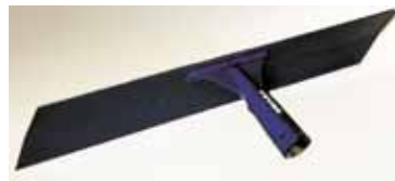
Raclette à enrobé Acier spécial de résistance 110 Kgs. Douille soudée : longueur 50 cm