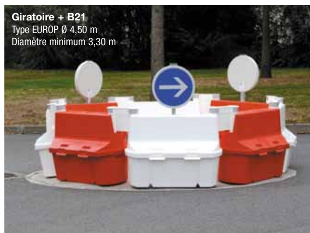
Giratoire + B21 Type EUROP Ø 4,50 m Diamètre minimum 3,30 m