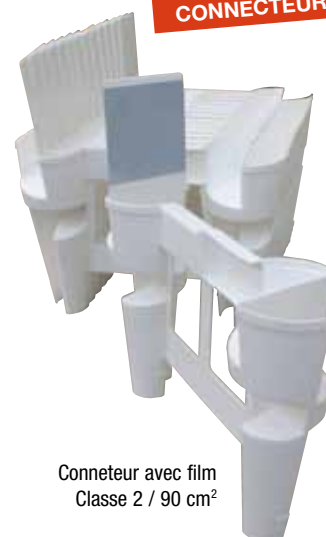
Connecteur avec film Classe 2 / 90 cm 2