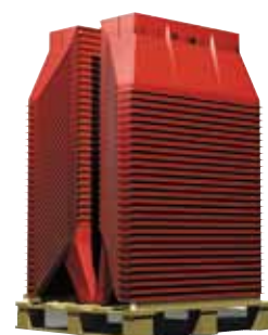
1 palette = 50 séparateurs