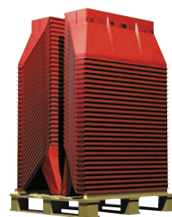
1 palette = 50 séparateurs