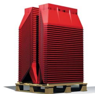
1 palette = 50 séparateurs