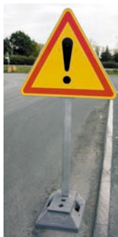
AK14 Profil sur mât