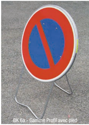
BK 6a - Gamme Profil avec pied