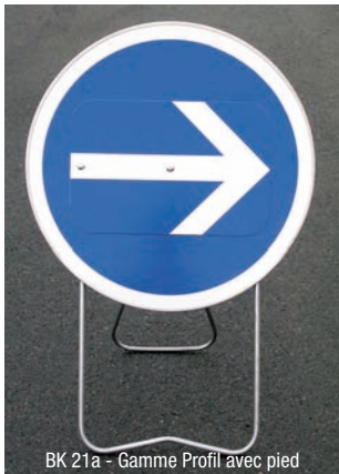
BK 21a - Gamme Profil avec pied