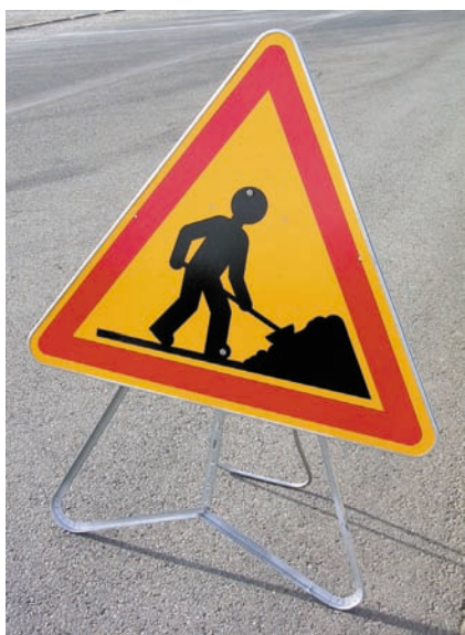
AK 5 Profil avec pied AN2