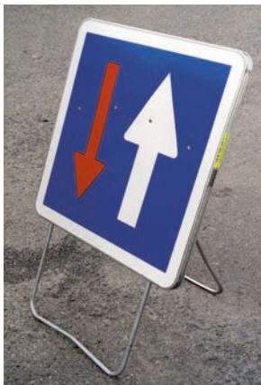
CK 18 - Gamme Profil avec pied