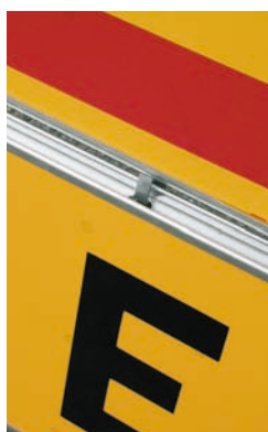
Clip de fixation pour KM